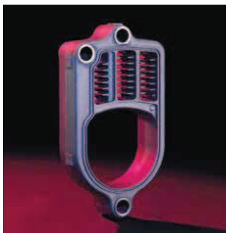
Ogrevalna površina Eutectoplex zagotavlja dolgo življensko dobo in zanesljivo obratovanje