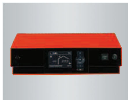
Preprosto upravljanje z regulacijo Vitotronic

Regulacija Vitotronic 200 z besedilnim in grafičnim prikazom omogoča uporabniku preprosto menijsko vodeno upravljanje. Regulira lahko tako ogrevalni sistem z enim ogrevalnim krogotokom brez mešalnega ventila, kot tudi ogrevalne sisteme z dvema mešalnima ventiloma.