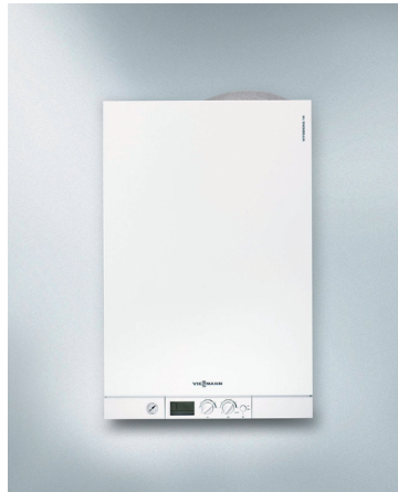
Vitodens 111-W Plinski stenski kondenzacijski kotel z integriranim hranilnikom sanitarne vode iz plemenitega jekla (od 4,7 do 35 kW)