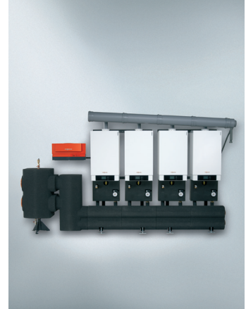
Vitodens 200-W Plinski stenski kondenzacijski kotli v kaskadah (od 90 do 900 kW)