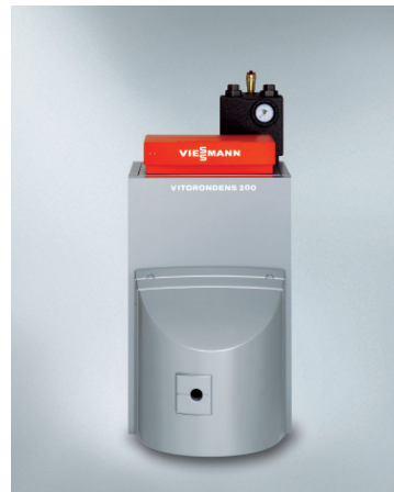
Vitorondens 200-T Talni oljni kondenzacijski kotel (od 20,2 do 107 kW) Vitorondens 222-F Talni oljni kompakten kondenzacijski kotel z emajliranim ogrevalnikom sanitarne vode (od 20,2 do 28,9 kW)