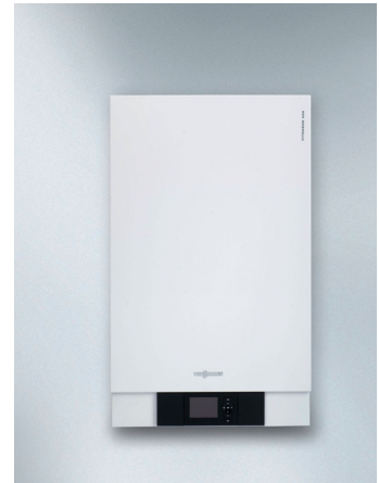
Vitodens 200-W Plinski stenski kondenzacijski kotel (od 1,8 do 150 kW) Vitodens 222-W Plinski stenski kondenzacijski kotel z integriranim hranilnikom vode 46 l (od 1,8 do 35 kW)