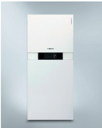
Vitodens 222-F Kompakten plinski kondenzacijski kotel z integriranim emajliranim hranilnikom (od 1,8 do 35 kW)