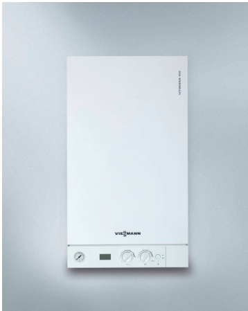
Vitodens 100-W Plinski stenski kondenzacijski kotel (od 4,7 do 35 kW)