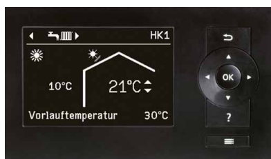
Regulacija toplotne črpalke Vitotronic 200

Z opcijskim internetnim vmesnikom Vitoconnect lahko toplotne črpalke zrak/voda Vitocal 100-S/111-S upravljate preko spleta. Z brezplačno aplikacijo ViCare je možno mnogo funkcij, kot so reguliranje temperature ali party obratovanje, nastaviti preprosto preko pametnega telefona.