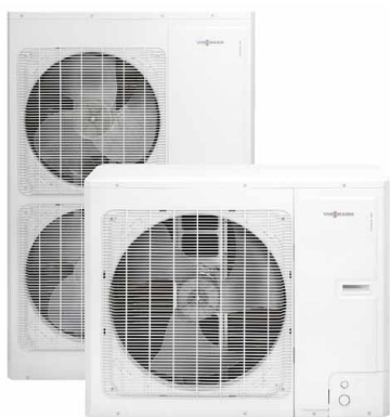
Zunanje enote za Vitocal 100-S/111-S