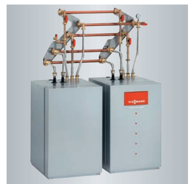
Dvostopenjska toplotna črpalka Vitocal 300-G (Master/Slave) - za hidravlično povezavo modulov toplotne črpalke je na voljo cevni komplet z armaturami in zapornimi pipami. Regulacijska povezava se izvede s pripravljenimi vodniki z vtiči

Za zgradbe z veliko potrebo po toploti je zanesljiva Vitocal 300-G po principu Master/Slave prava rešitev. Dosega ogrevalne moči od 12,4 do 43,2 kW. Tudi tukaj obstaja izbira za obratovanje s toploto iz zemljišča ali iz podtalnice.